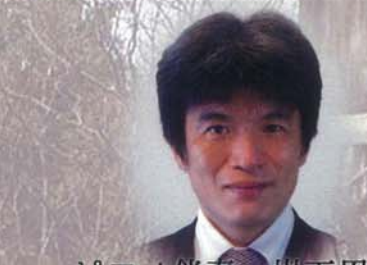
ピアノ伴奏：岩下周二